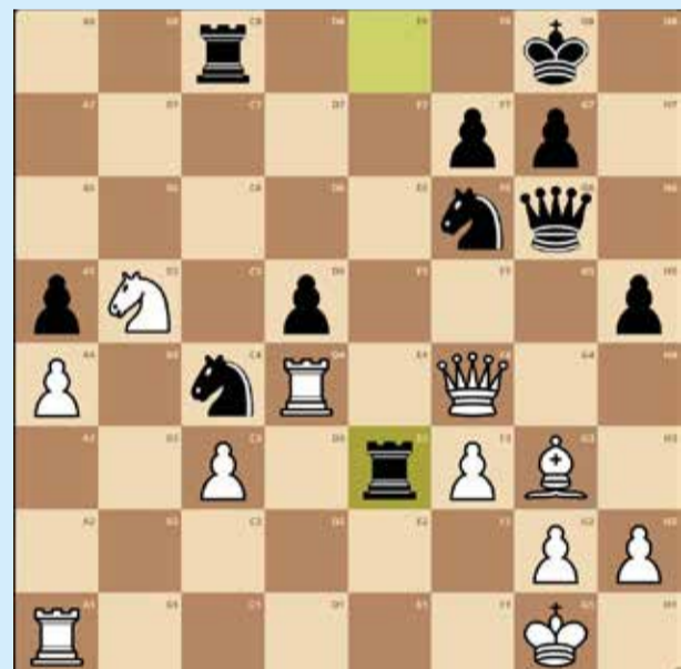
Brancas jogam. Resposta: Txc4, dxc4 Dxe3