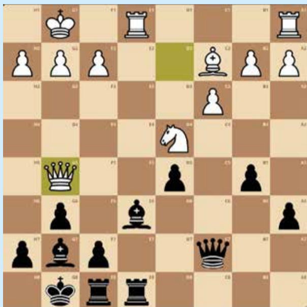
Pretas jogam. Resposta: Bxd4, cxd4, Dxc2